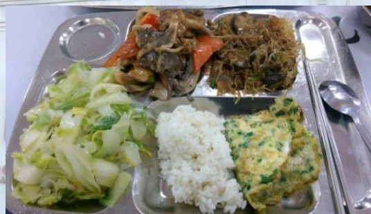
▲ 上圖為東區食堂的菜色

對剛到北京的我來說，北方的食物對我來說太油、太鹹、和偏辣。因此沒幾個禮拜，因為飲食的不適應，我就急性胃炎掛急診了。那時剛好遇上十一連假，所以整個連假那兒都不能去，乖乖在宿舍養病。不過，也因為生了這一場病，讓我的胃有了免疫，適應了大陸北方的烹調方式以及調味。