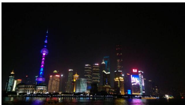
▼ 下圖左為上海東方明珠、右為哈爾濱冰雪大世界